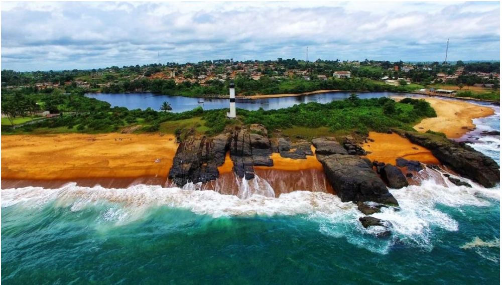
Image 5 : Le phare, symbole historique et actuel de la ville de Tabou

Atouts et freins en lien avec le ..... AHOUE J. – J., AKA A. M. & OUATTARA D. établissements scolaires et de la radio locale. Perché à une certaine hauteur au cœur d'une végétation luxuriante, entouré par la mer et le fleuve Tabou, ce phare offre une vue magnifique d'une île (cf. photo 3). C'est un lieu dont la renommée constitue un prétexte de visite pour toute personne passionnée de découverte. On y trouve également des maisons de commerces européennes, des postes administratifs, des écoles, dont la première de la région de San Pedro, des résidences européennes, un pont, etc. (P. KIPRE, 1981, p.102).