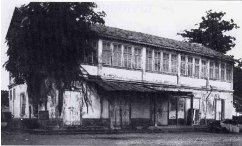
Photo n°2 : le bâtiment de la compagnie forestière de l'Indenié, vu en 1981