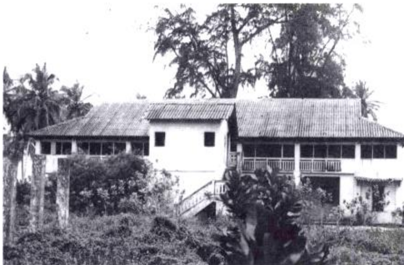
Photo n° 1 : ancienne résidence du commandant de cercle de grand labou, vu en 1981