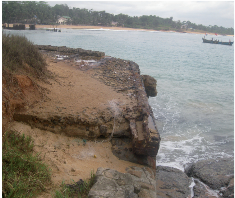
Fig. 3 : le port colonial de Grand Béréby.

Ce port, aux coordonnées géographiques 4°34'11" nord et 7°0'22" ouest/Alt. 3 m, est composé d'un débarcadère, construit en 1950 et d'un quai, construit en 1958 6 . Il a joué un rôle important dans le commerce maritime, pendant la colonisation. Son quai est totalement constitué de fer. Cependant le débarcadère est fait en béton armé.