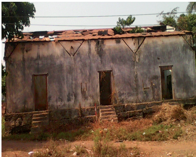
Fig. 1 : une maison de commerce française à Tabou.

Cette bâtisse a été construite vers 1930 dans la ville de Tabou et elle fut l'une des maisons de commerce français. Elle est située à 200m au sud du camp des gardes de prison de la ville avec pour coordonnées géographiques, 29 N 068280/0488118 Alt. 14 m. Pour sa construction, les murs en briques de terre cuite ont été posés sur un soubassement en briques de pierres taillées et recouverts d'une toiture en tôles. Elle compte trois (3) portes et cinq (5) fenêtres en bois.