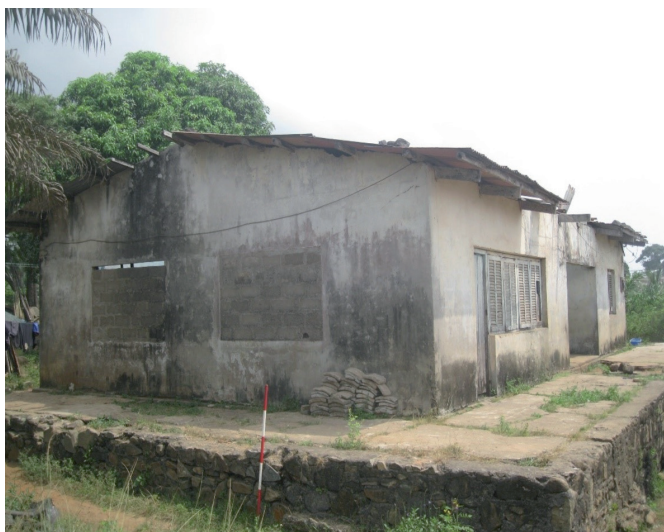
Fig. 2 : une résidence de commerçants Français à Tabou.

Ce bâtiment abandonné, construit vers 1930 a été une résidence de commerçants français, précisément ceux de la SCOA (Société Commerciale d'Afrique de l'Ouest) 5 . Cette résidence est située au quartier Tiobo-Tiobo de la ville de Tabou, à 150 m du camp du fonctionnaire colonial avec pour coordonnées géographiques, 29 N 06818/0487852 Alt 16 m. Avec un soubassement d'environ 0.5 m, ce bâtiment a des murs en brique de terre cuite et une toiture de tôles. Il compte deux (2) portes et six (6) fenêtres en bois.