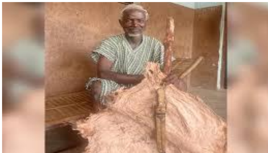
Photo 1 : Le plus ancien griot de N’Goloblasso (Tiémé) dans l’exercice de la tannerie